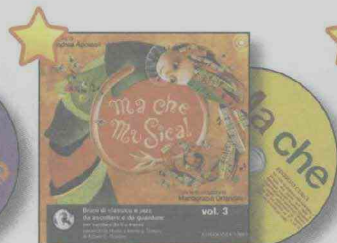
Illustrazioni di Maria Grazia Orlandini MA CHE MUSICA! VOLUME 3. Con CD EC 11691 (il)