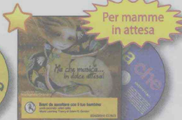
Illustrazioni di Maria Grazia Orlandini MA CHE MUSICA... IN DOLCE ATTESA! Con CD EC 11754 (il)